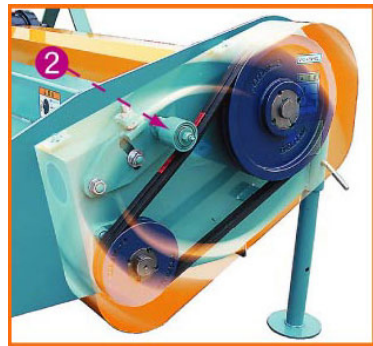
◎本写真は機能説明のためCG処理をほどこした物で実際の見え方は異なります。

高速・高馬力型の駆動用Vベルト採用により、シーズン中のメンテナンスから解放されます。